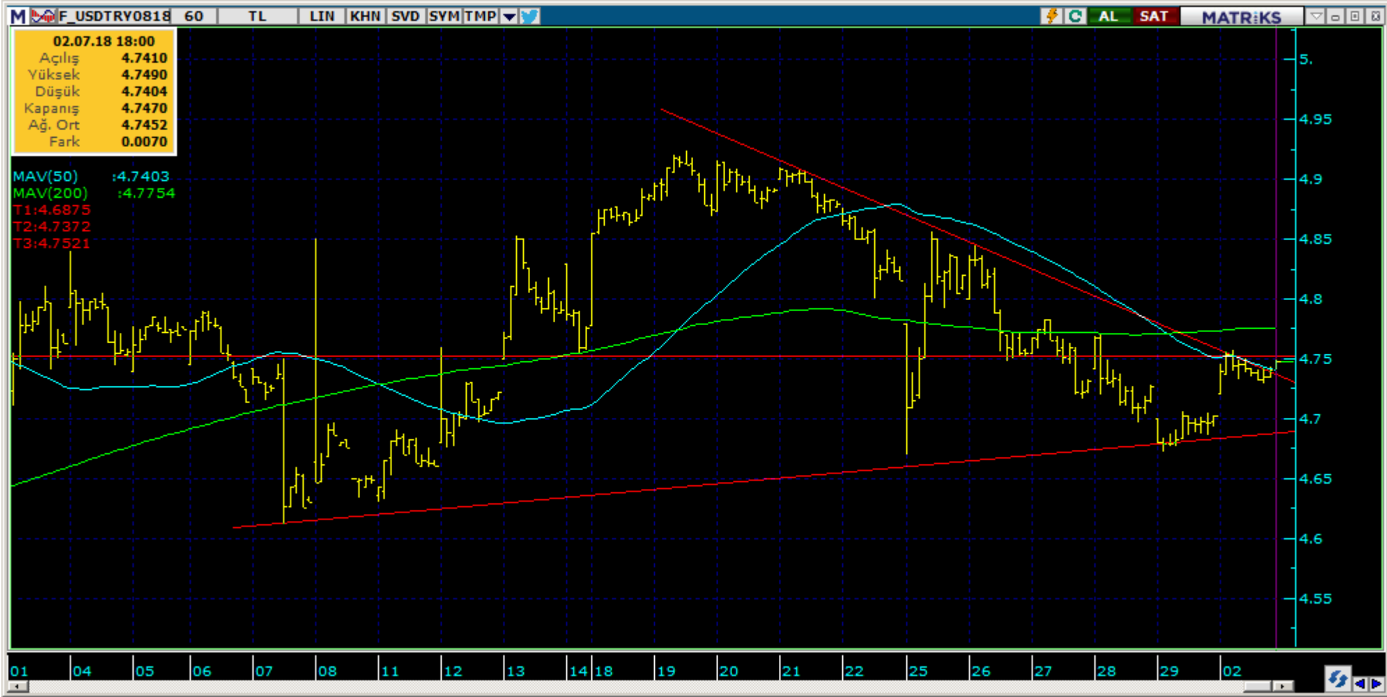
Destek Direnç Seviyeleri ve Pivot Değeri